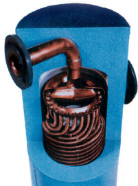
Rohrbündel im Mantel

Siehe Fließschema des betreffenden Wärmeübertragertyps. Im Allgemeinen sollte das Medium mit der niedrigeren Durchflussrate durch das Rohrbündel geleitet werden. Bitte beachten: Brauchwarmwasser muss immer durch das Rohrbündel fließen.