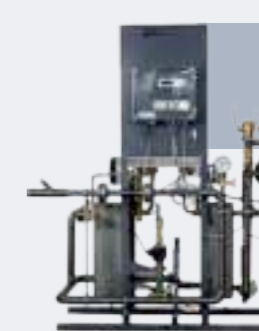
Fernwärme - und Fernkältestationen